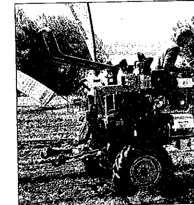
La position haute du siège sur ce prototype permet de travailler avec une grande visibilité.